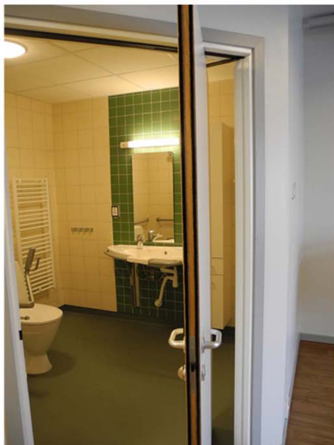
Dörr in till badrummet i lägenheten kan öppnas både inåt och utåt för ökad tillgänglighet. Badrummet är utrustat med Bano-inredning (handtag på handfat, högskåp & i dusch) för att underlätta för den boende att klara sig själv. Kontrastmarkering bakom handfattet.