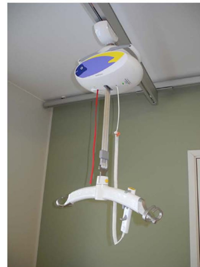
Alla 51 st. lägenheterna är utrustade med skensystem för taklyftar. Varje avdelning har två lyftar var att använda vid behov.