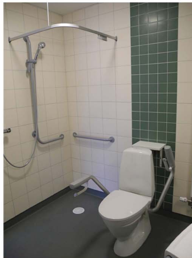
Alla toalettstolar i lägenheterna är framflyttade 20 cm från vägg för att förbättra lyftergonomin för personalen. Duscharna är utrustade med handtag för att underlätta för den boende. Mattan är halksäker. Kontrastmarkering bakom toalettstolarna.